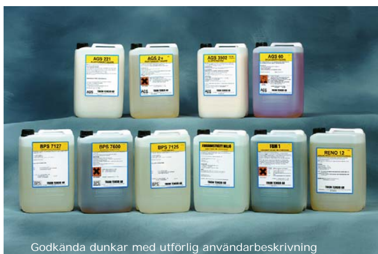
Godkända dunkar med utförlig användarbeskrivning

Brandsanering: Produkter för sanering av fastigheter och lösöre. Luktsanering efter brand m.m.