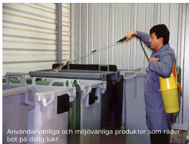
Användarvänliga och miljövänliga produkter som råder bot på dålig lukt