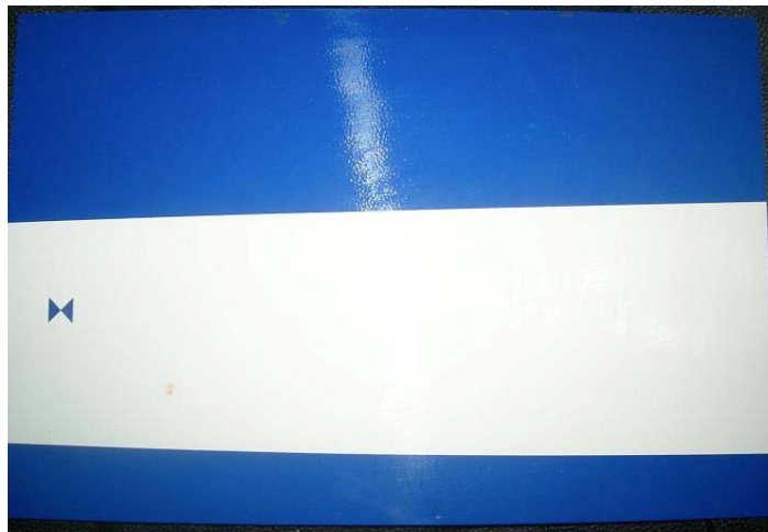
Figur 5:18 Efter sanering av spray på yta behandlad med Signshine. Inga rester eller skuggor.