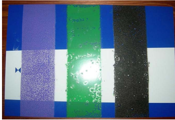
Figur 5:13 Efter sprayklotter på yta behandlad med Signshine.