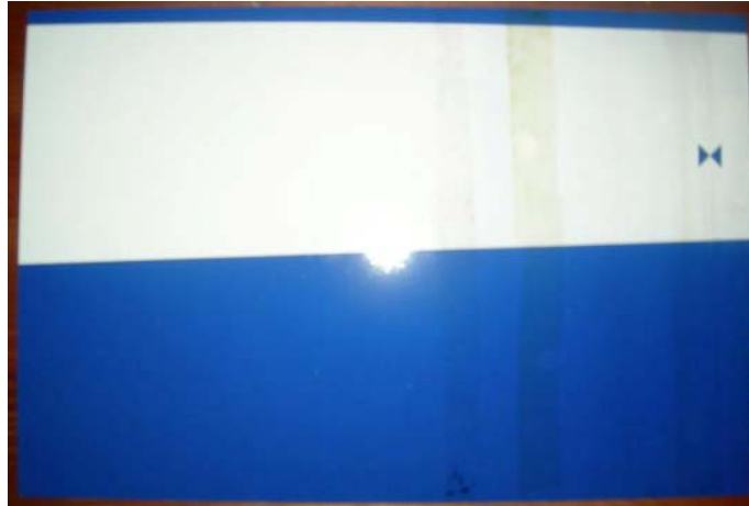
Figur 5:17 Efter sanering av yta behandlad med Signshine. Svaga skuggor efter bläcket och alla tuschpennor.