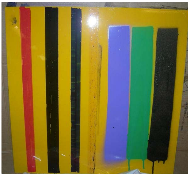
Figur 5:9 Efter klottring på yta behandlad med Permaprotect.

På detta skydd fäster färgerna utan några större problem. Det är endast bläcket som inte fäster utan rinner av, däremot lämnar bläcket direkt en missfärgning.