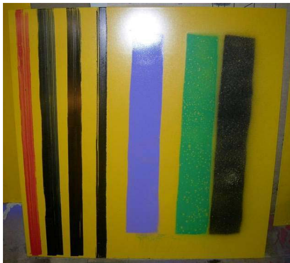
Figur 5:11 Efter klottring på yta behandlad med 9606 från LJ-Kem.

Alla färger fäste bra på detta skydd. Ingen klotterbortstötande effekt kunde märkas.