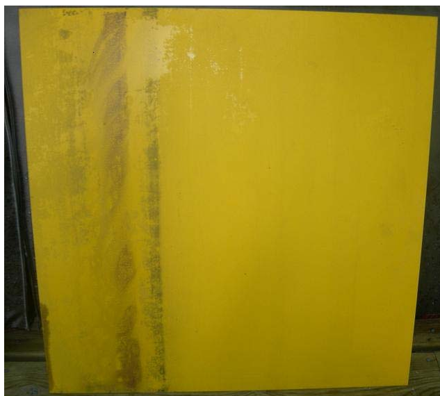
Figur 5:19 Efter sanering av yta behandlad med Klotterskydd 9606 från Lj-kem. Mycket svårsanerat, skyddsytan till viss del förstörd.