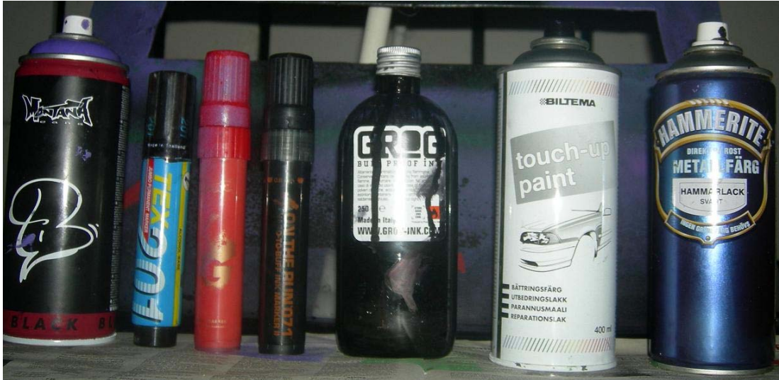
Figur 5:1 De olika sorters klotterfärger som används i testerna av klotterskydd.

Det gjordes även sökningar på internet för att hitta ytterligare klotterskydd. De klotterskyddstillverkande företagen kontaktades sedan för att utröna om de hade produkter lämpliga för min uppgift, det vill säga skydd och saneringsmedel för lackerad plåt och utomhusbruk. Det som kunde konstateras efter att ha gjort efterforskningar om marknaden är att saneringsbranschen är enorm, men däremot finns det ganska få aktörer som framställer själva klotterskydds- och saneringsprodukterna. Efter kontakt med dessa företag hade sju av dem produkter som var lämpliga för fordon i sitt sortiment. Av dessa kom fem med i mitt arbete. De företag som medverkar i min utredning är: