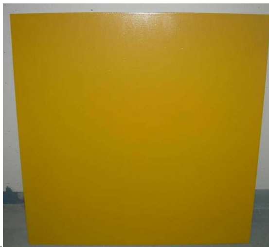
Figur 5:6 Yta behandlad med klotterskydd 9606.

Detta skydd appliceras med roller, spruta eller pensel. Jag använde roller vid min applicering. Efter blandning av komponenter bör skyddet appliceras inom två timmar. Full motståndskraft mot klotter finns efter 48 timmar. Även detta skydd är mycket lättapplicerat, dock något svårt att få en jämn yta med roller då lätt luftbubblor bildas. Att spruta på skyddet skulle nog vara att rekommendera på stora ytor. Skyddet bildar en något blek matt yta.