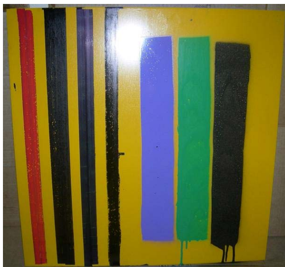
Figur 5:10 Efter klottring på yta behandlad med P-590 Protector.

Färgen fäster utan problem även om viss skillnad finns på röd Montana och bläcket som fäster lite sämre än de andra.