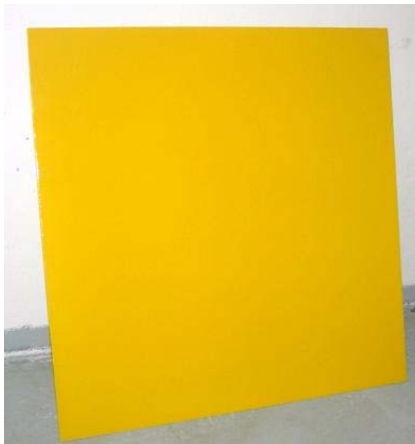
Figur 5:4 Efter applicering av Permaprotect.

Detta skydd är ett tvåkomponentsskydd som passar speciellt bra till rena eller lackerade plåtytor. Efter blandning av komponenterna så bör skyddet användas inom 6 timmar. Applicering sker med lågtrycksspruta eller finskumroller. Full motståndskraft mot klotter nås efter 12-24 timmar beroende på temperatur. Jag använde finskumroller vid min applicering och detta var det skydd som var lättast att applicera. Skyddet är relativt trögflytande vilket gjorde att det var lätt att få en blank och fin heltäckande yta. Detta skydd är det som mest liknar en klarlack och ger en mycket blank yta efter härdning.