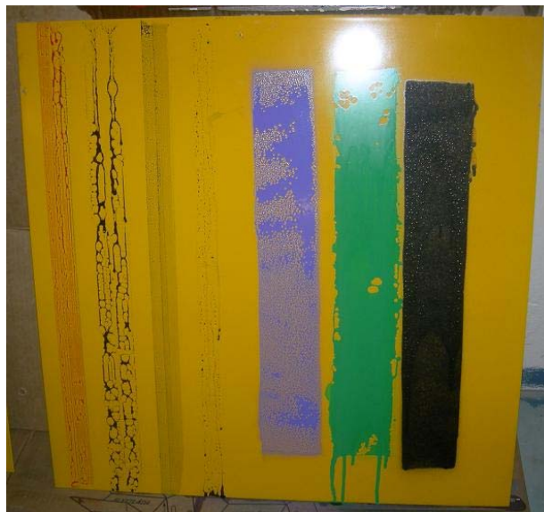
Figur 5:8 Efter klottring på yta behandlad med Tutoprom.

På tutoprombehandlad yta fäster inte färgerna, endast sprayfärgen från Hammerite ger ett heltäckande färglager. Klotterfärgerna rullar ihop sig på ett sätt som om det vore en fet yta, speciellt tusch.