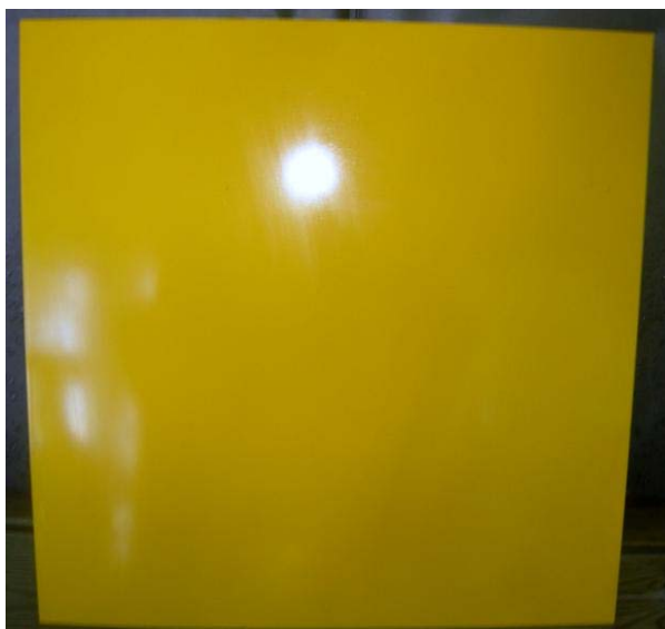
Figur 5:14 Resultatet efter sanering av yta behandlad med Tutoprom är en helt ren plåt utan några skuggor eller missfärgningar.

Första saneringen på Tutoprom gick mycket lätt när den svagaste saneringsvätskan verkat ett tag. Tusch, bläck och sprayfärgerna från Montana och Biltema löstes upp direkt och kunde lätt torkas bort. Sprayen från Hammerite satt lite hårdare och krävde längre tid för saneringsvätskan att verka. Tiden för att sanera hela plåten och att få den helt ren igen tog 9 min. Resultatet efter sanering är en helt ren plåt utan några skuggor eller missfärgningar. I de efterföljande fyra testerna kunde inga försämringar av skyddet skönjas. Tidsåtgång för efterföljande tester var ungefär densamma, 10 \pm 1 min.