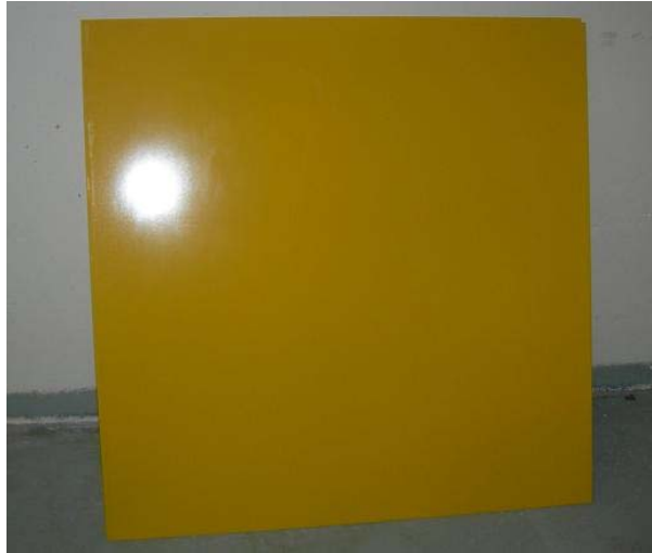
Figur 5:3 Efter applicering av P-590 Protector.