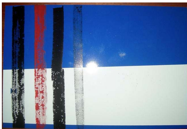
Figur 5:12 Efter klottring med tusch och bläck på yta behandlad med Signshine.

På detta skydd vill inte färgerna fästa riktigt, det är speciellt svårt att få en heltäckande färgyta med sprayfärgerna.