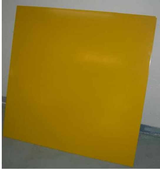
Figur 5:2 Efter applicering av Tutoprom på försöksytan som består av lackfärg i kulör RAL 1004 lackerat på 500x500mm stålplåt.