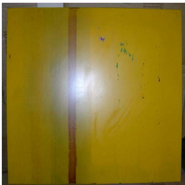
Figur 5:16 Efter sanering av yta behandlad med P-590 Protector. Tusch och bläck har tagit sig in i underliggande lack.