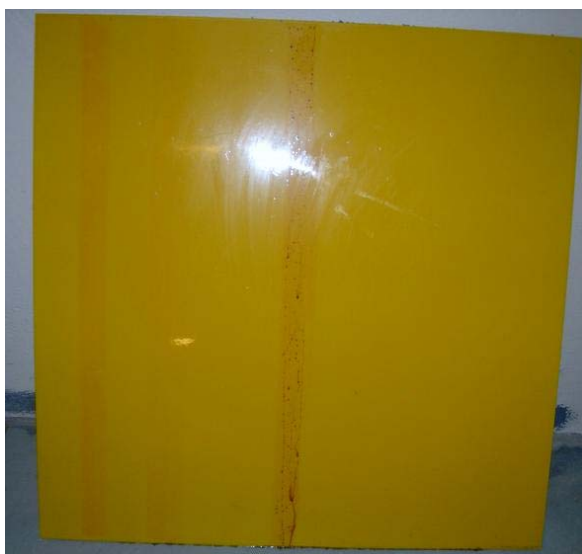
Figur 5:15 Efter sanering av yta behandlad med Permaprotect. Tusch och bläck lämnar vissa skuggor.

färgning efter den röda Montanapennan. Den svarta On the run pennan lämnade också en missfärgning men ytterst svag.