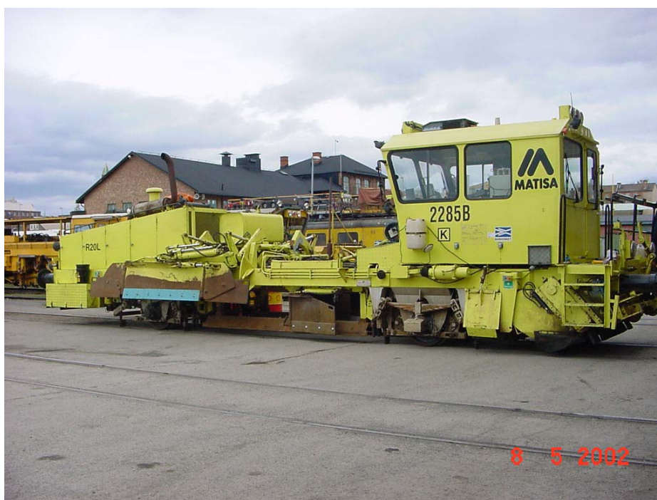
Figur 2:1 Bild av hur ett av Banverket Produktions fordon kan se ut.

Banverket Produktion är Nordens ledande järnvägsentreprenör och sysslar med att underhålla och bygga ny järnväg. Banverket produktion skiljdes från Banverket 1998, 10 år efter att tågtrafiken avreglerats och SJ delats upp och skiljts från Banverket. Sedan 2002 konkurrerar man på en öppen marknad. Banverket produktion har ca 3000 anställda och äger 450 specialfordon som på olika sätt är anpassade för att klara av det mesta när det gäller järnvägsunderhåll och bygge av ny järnväg. Banverket Produktion har sex distriktskontor belägna i Stockholm, Luleå, Gävle, Nässjö, Göteborg och Malmö. 1