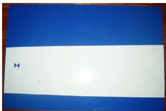
Figur 5:5 Färdigapplicerad plåt med Signshine.

Signshine är som beskrivet tidigare en självhäftande folie. Applicering sker i ark av folien och för att underlätta placering kan vatten med några droppar diskmedel sprayas på ytan som ska täckas. Eftersom detta är en folie så behövs ingen torkningstid utan skyddet har full motståndskraft mot klotter redan direkt efter applicering. Folien klarar också välvda ytor utan att vecka sig. Något omdöme utifrån egen applicering kan ej göras här då folien till mina tester levererades redan applicerad på testplåtar.